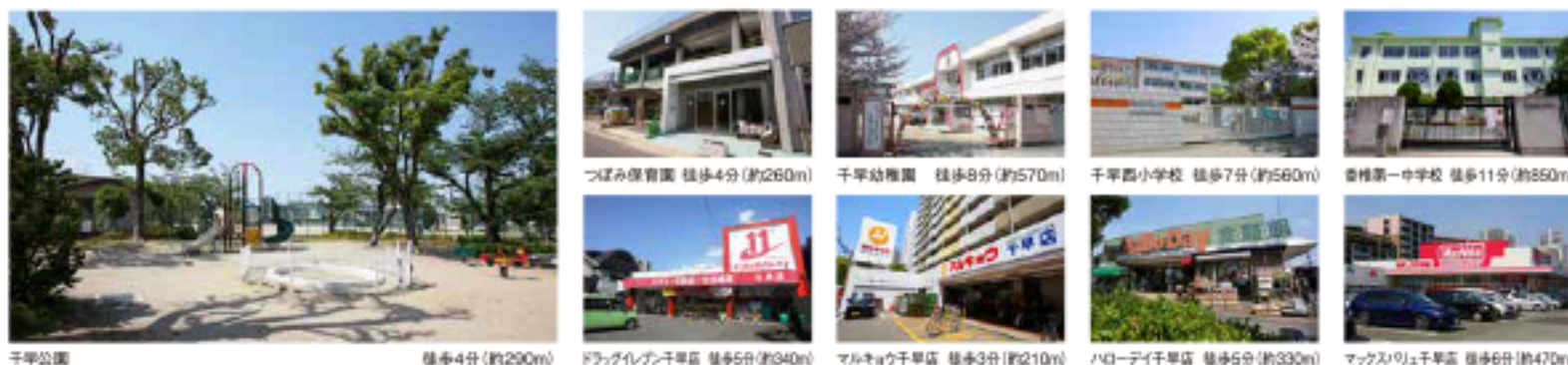
千早公園 徒歩4分(約290m) つばみ保育園 徒歩4分(約260m) 千早幼稚園 徒歩9分(約570m) 千早西小学校 徒歩7分(約560m) 香椎第一中学校 徒歩11分(約850m) 千早公園 徒歩4分(約290m) フラッグレイン千早店 徒歩5分(約340m) マルキョウ千早店 徒歩3分(約210m) ハローデイ千早店 徒歩5分(約330m) マックスリュウ千早店 徒歩6分(約470m)