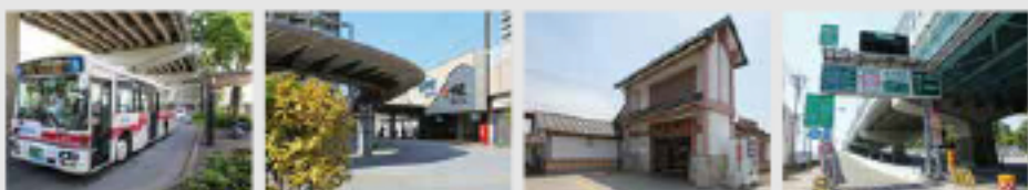
都市高速バス停 徒歩 約4分 JR千早駅 自転車 約6分 西鉄名島駅 自転車 約4分 都市高速名島ランプ 車 約2分