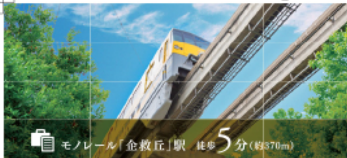
モノレール「企救丘」駅 徒歩5分(約370m)