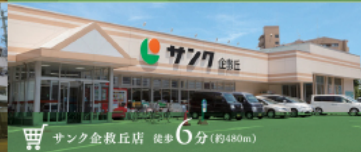
サンク企救丘店 徒歩6分(約480m)

子どもの未来を豊かに育む教育環境。 サンパーク企救丘グラッセから志井幼稚園へ徒歩4分、通学区の志井小学校へ徒歩6分、志徳中学校へは徒歩17分。