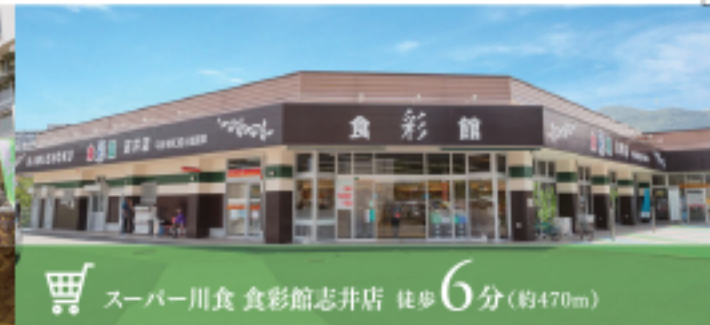
スーパー川食 食彩館志井店 徒歩6分(約470m)