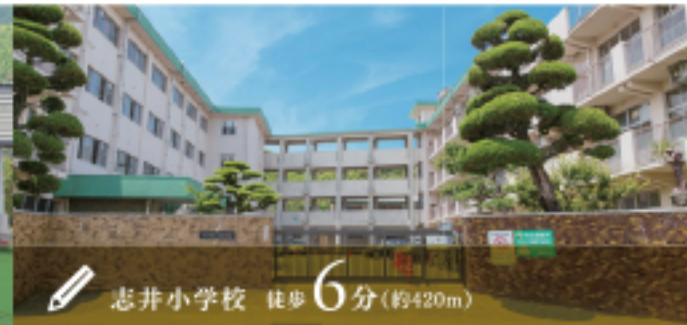
志井小学校 徒歩6分(約420m)