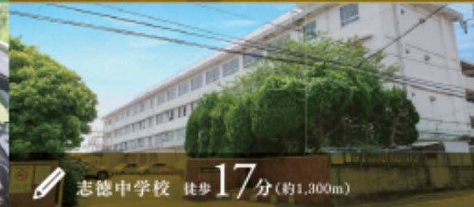
志徳中学校 徒歩17分(約1,300m)

家族の楽しみが広がるカーアクセス。 九州自動車道「小倉南IC」へ車で約6分的好アクセス。九州エリアや本州も自在にアクセスできます。ご家族でドライブやレジャーの楽しみも広がります。