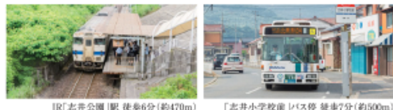
JR「志井公園」駅 徒歩6分(約470m)